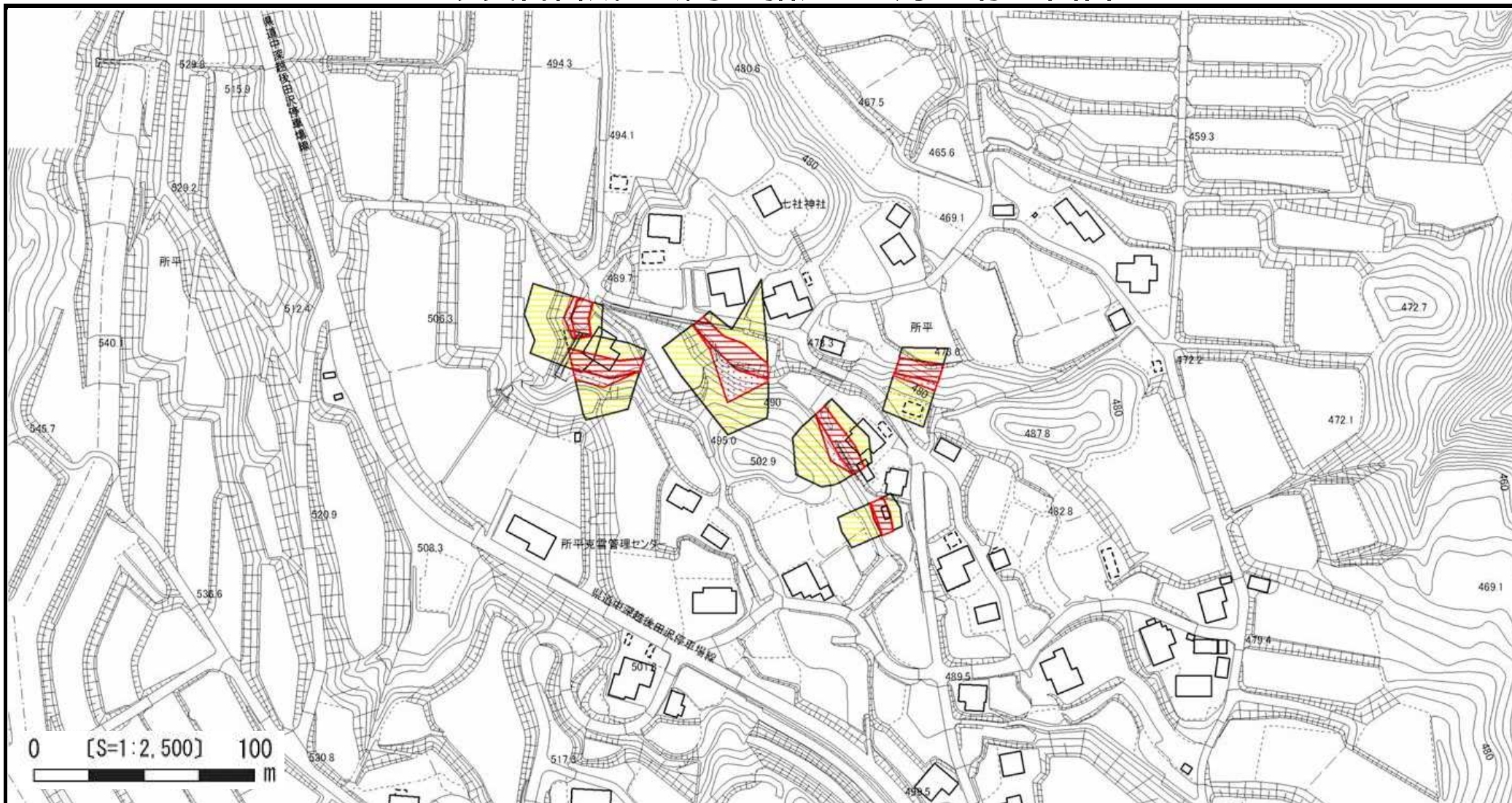
様式 - 2 (急)